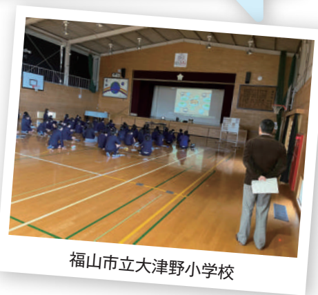
福山市立大津野小学校