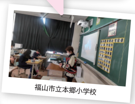
福山市立本郷小学校