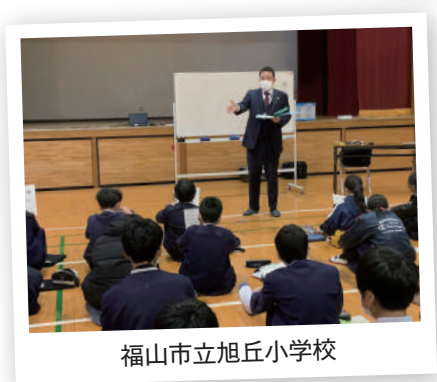
福山市立旭丘小学校