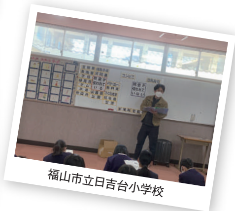
福山市立日吉台小学校