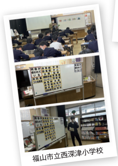
福山市立西深津小学校