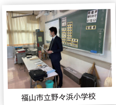
福山市立野々浜小学校